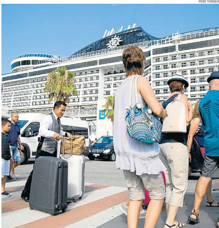
Creueristes després de desembarcar a Barcelona.

L'entitat inclou el sector en la seva iniciativa creada per augmentar la productivitat de l'economia catalana